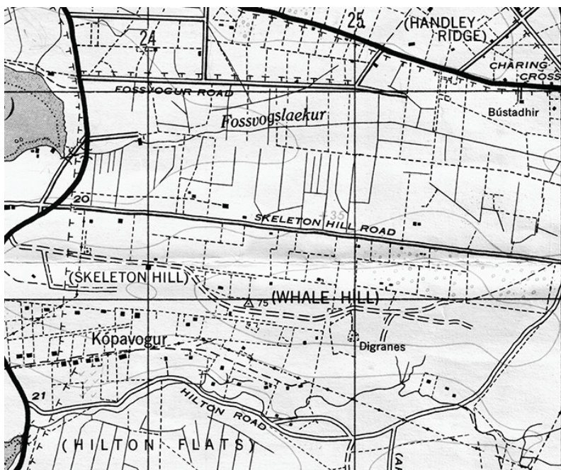
Mynd 2. Brot úr korti bandaríska hersins af Reykjavíkursvæðinu: GSGS 4186, 1941, endurskoðað 1943: A.M.S. C861.